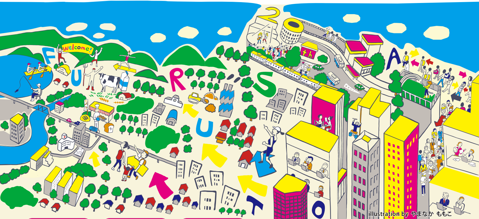
illustration by やまなか ももこ