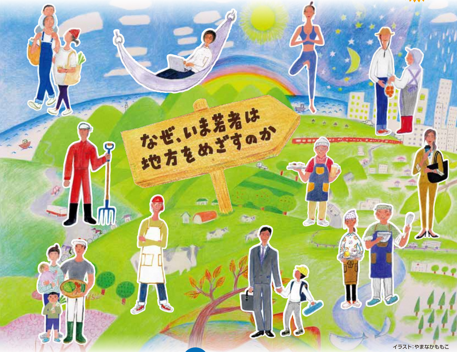
イラスト:やまなかももこ